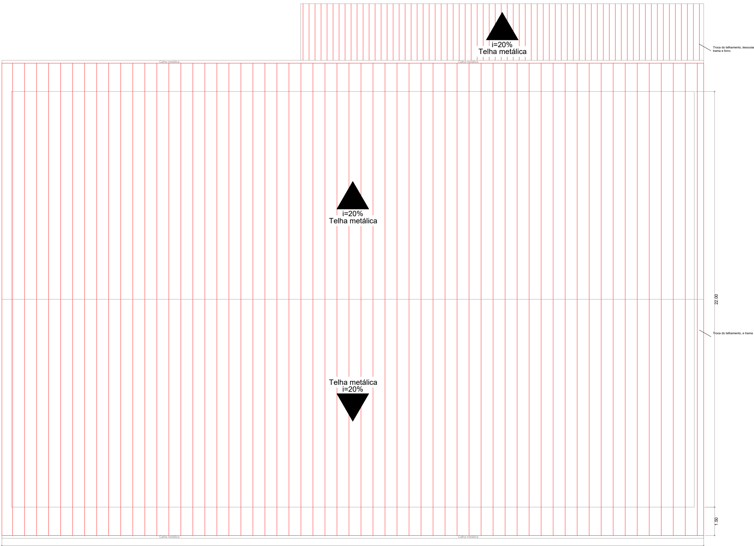
PLANTA DE COBERTURA ESCALA 1:100

NOTA: Assim que o telhado dos banheiros for removido, a área deverá ser imediatamente coberta com lona. Durante a execução do telhado, deverá ser respeitada a NR-35.