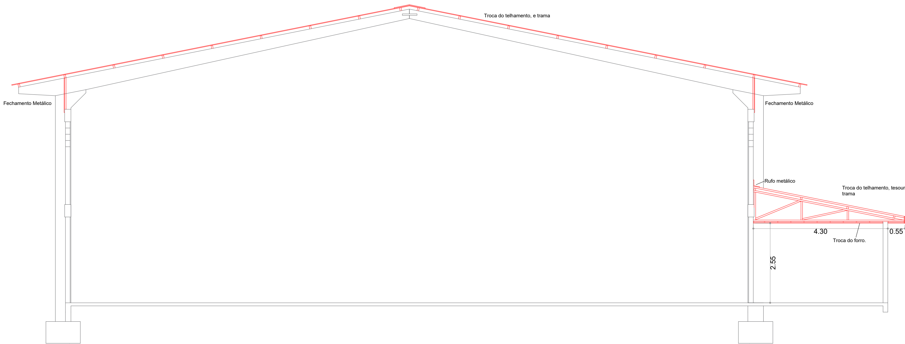
Corte AA Esc.: 1/75

NOTA: Assim que o telhado dos banheiros for removido, a área deverá ser imediatamente coberta com lona. Durante a execução do telhado, deverá ser respeitada a NR-35.